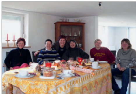
Gut durchgeschwungt läßt es sich leichter lachen.