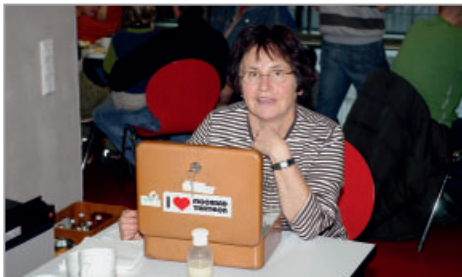
Die Kasse beim Kuchen ist in guten Händen.

Ach ja – wo wir gerade dabei sind: Alle 2 Jahre wieder – steht der Sportlerball 2008 vor der Tür! Für den Verein immer eine „Mammut-Veranstaltung“, weil wir hier auf die Mithilfe von Vielen angewiesen sind. Die Vorbereitungen sind schon im Gange – und schon bald wird wieder die berühmte Liste aushängen!