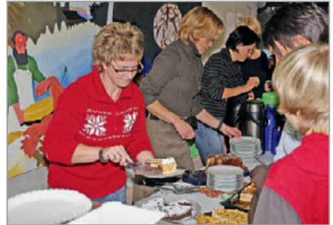
Natürlich auch zum Mitnehmen, für alle Wünsche offen.