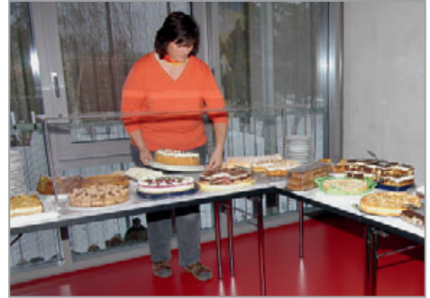
Jetzt kann es losgehen, alle Kuchenspenden sind aufgebaut.