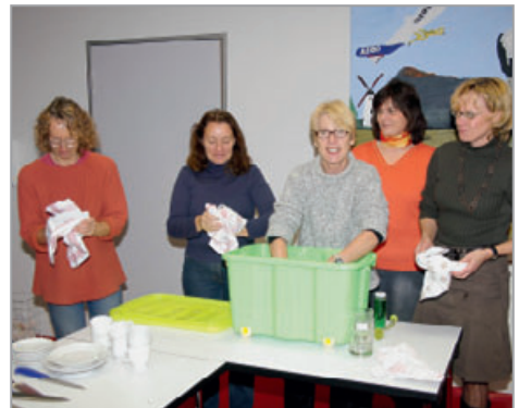
Die Spülstraße läuft auch reibungslos.