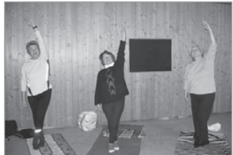
Yoga hält jung

Nun ist es also doch schon wieder rum, das Jahr 2007, wir haben viel erlebt und erfahren und auch verändert. Ein Neuheit soll auch die Webseite unseres Vereins werden. Dafür brauchen wir aber auch wieder mal aktuelle Fotos. Darum seid ihr hiermit schon mal "vorgewarnt", dass im Neuen Jahr auch bald mal neues Fotomaterial von allen Gruppen gemacht werden muß. Nur mit aktuellen Bildmaterial kann man auch einen aktiven Verein darstellen.