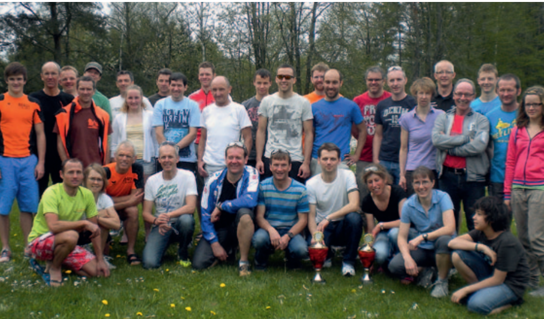
Die Teilnehmer des Testtriathlons in Bad Wurzach