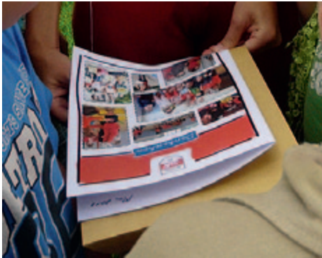
Eine Karte mit vielen Fotos aus den letzten Jahren sollen Olga und Brigitte noch lange an diese Zeit erinnern.