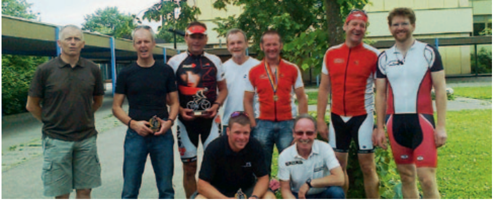
Erfolgreiche Herlazhofer Triathleten