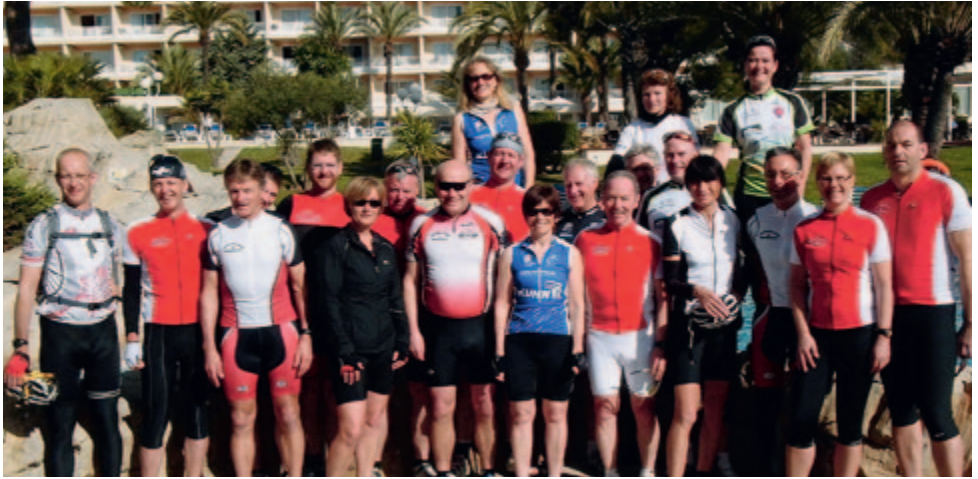
Das Leben im Trainingslager kann ja so hart sein!