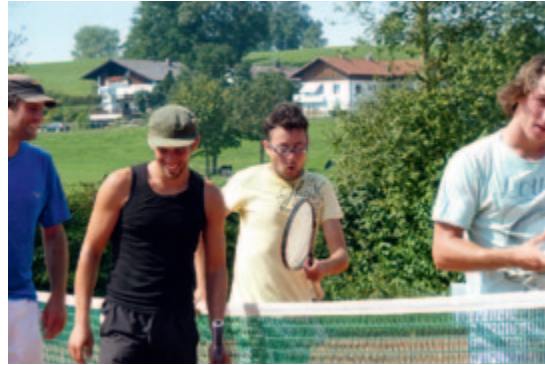
Doppel-Mixedturnier 2011: Spiel und Spaß auf heißem Sand