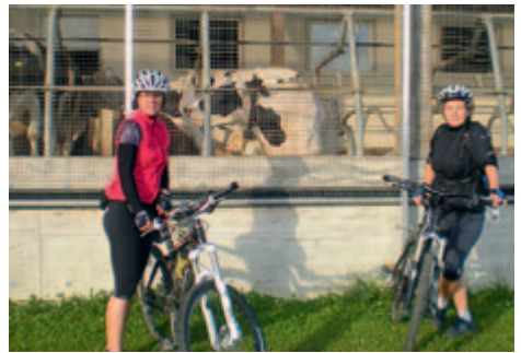
Die Mountainbiker-Gruppe bei einer Allgäurundfahrt mit all ihren Schönheiten

Wer neu einsteigen will und ausprobieren möchte, wo er/sie steht, kann gerne vorbeischauen und 1 bis 2 Mal zum Schnuppern mitradeln.