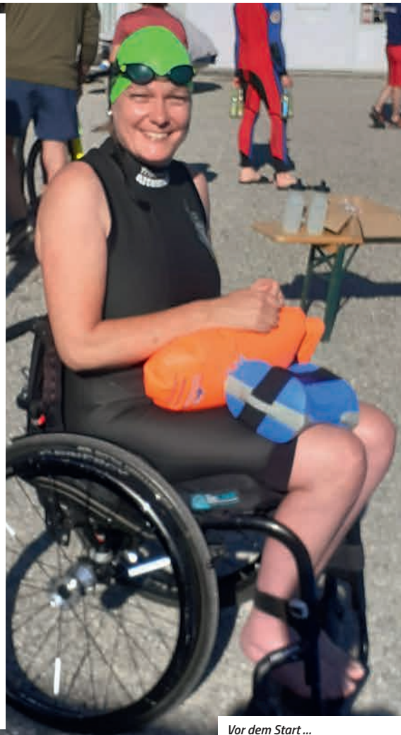
Vor dem Start ...

Ich freue mich über die Offenheit des Veranstalters und die vielen anpackenden Hände, die mir dieses besondere Erlebnis ermöglicht haben. Danke.