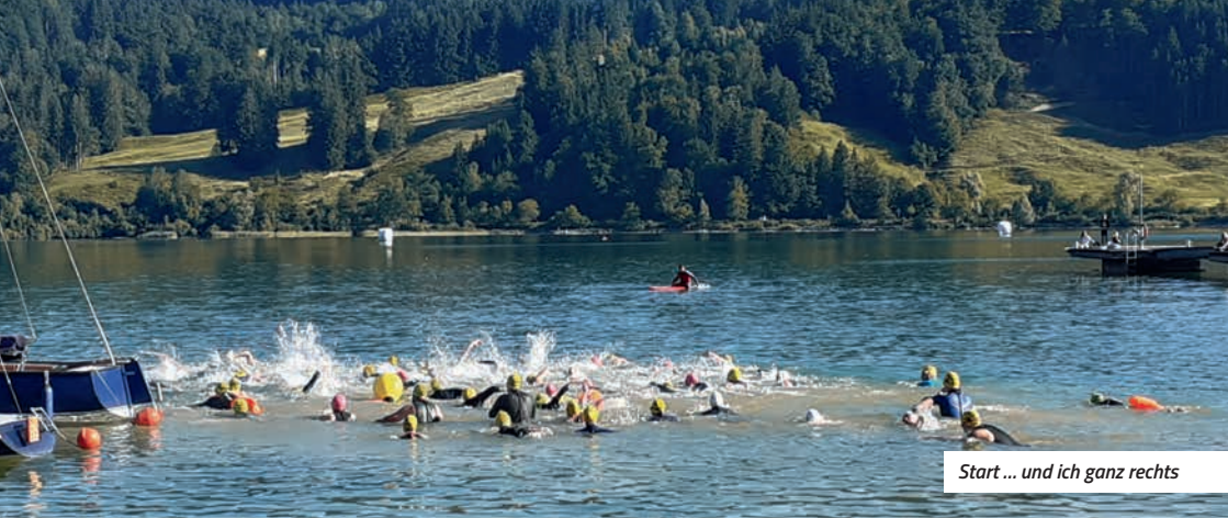
Start ... und ich ganz rechts

Die erste Runde ist dann auch bald schon geschafft und ich rufe aus dem knietiefen Wasser, dass ich es bin, die ja keinen Landgang machen kann. Zwei Mitschwimmer, die direkt hinter mir ans Ufer geschwommen sind, wollen mir ganz gentlemanlike den Vortritt für den Landgang lassen und brauchen etwas Zeit, um zu verstehen, was das gerade für eine Situation ist. Im Wasser sieht man mir ja meine Behinderung nicht an. Das führt schon manchmal zu Verwirrungen.