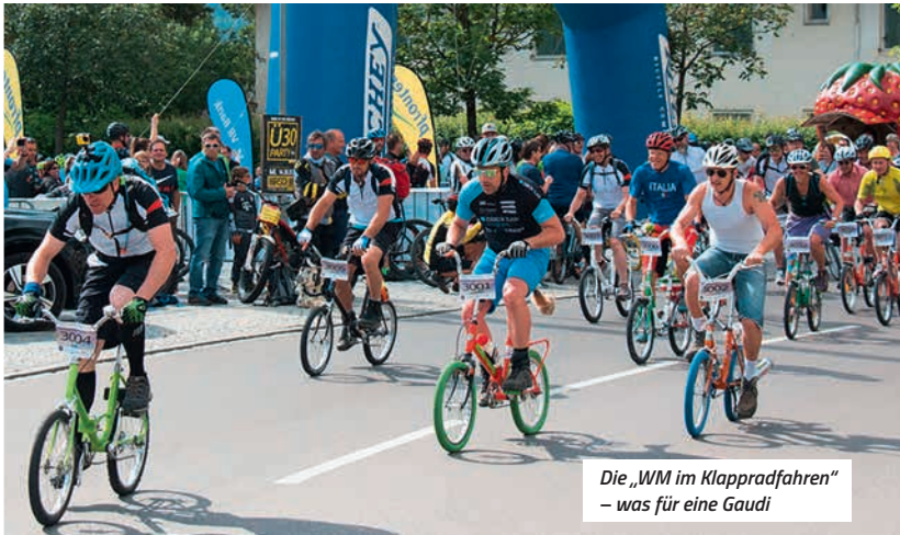
Die „WM im Klappadfahren“ – was für eine Gaudi