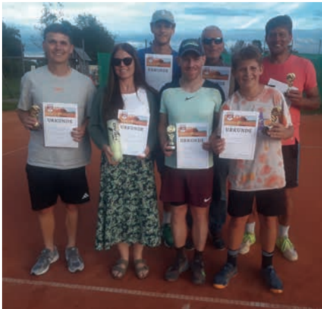
Clubbers 2023 – Siegerfoto

In der Woche vom 23. – 30. Juli 2023 fanden wieder die alljährlichen Tennis Clubmeisterschaften beim SVH statt. Dem anfänglichen Sauwetter zum Trotz konnten alle Begegnungen im 32er-Feld der A-Runde und dem parallelen 16er-Feld der B-Runde aus- gespielt werden.