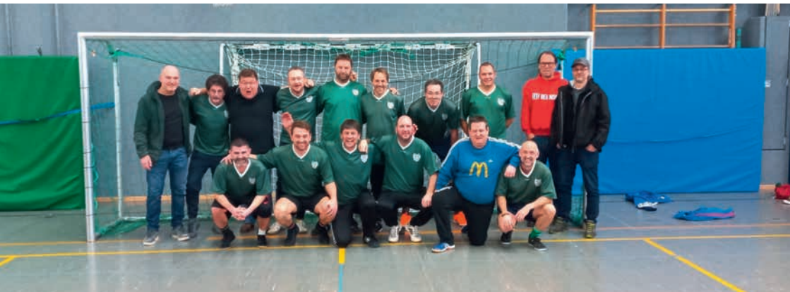
Sieger der Herzen – „Selleries Vollmond“ bei ihrer 31. Teilnahme. Sie brachten die Halle zum Beben!