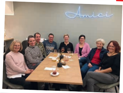
Gemütliche Runde im Amici