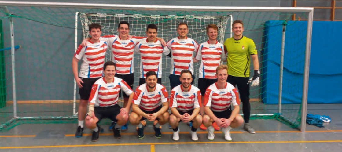
Turniersieger „SpVgg Ringwegsiedlung“