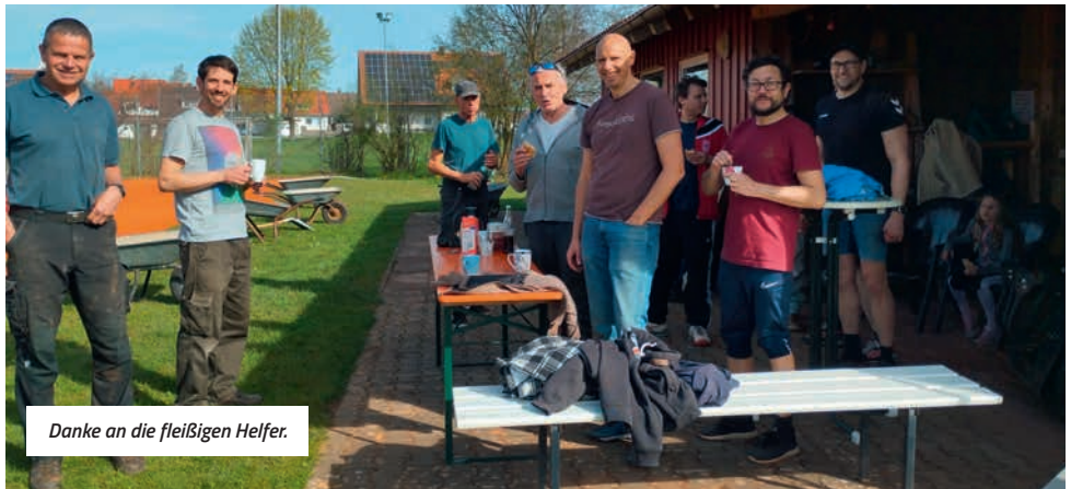
Danke an die fleißigen Helfer.