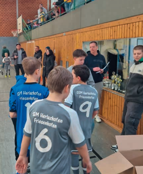
Siegerhebung – unsere SGM Jungs erreichen Platz 4 beim E-Jugend Turnier

Im ersten Halbfinale kam es zum Duell zwischen dem FV Ravensburg und dem VfB Hohenems, das der FV Ravensburg mit 5:2 für sich entschied und somit ins Finale einzog.