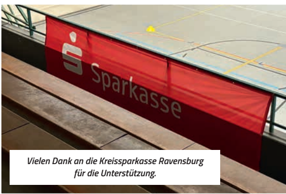
Vielen Dank an die Kreissparkasse Ravensburg für die Unterstützung.