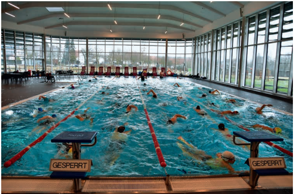
Hallenbad wurde zum „Haifischbecken“ mit 37 Kraulschwimmer

Bis zum Drei-Königs-Tag waren schon erstaunliche 900.- € an Spenden eingegangen. „Wir wollten mit der Aktion auch unsere Dankbarkeit für das tolle Hallenbad und unsere Verbundenheit mit der Stadt Bad Wurzach zeigen,“ meinte zusammenfassend Abteilungsleiter Werner Utz zum Schluss.