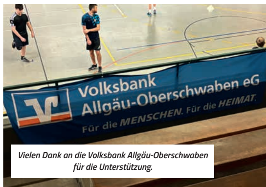
Vielen Dank an die Volksbank Allgäu-Oberschwaben für die Unterstützung.