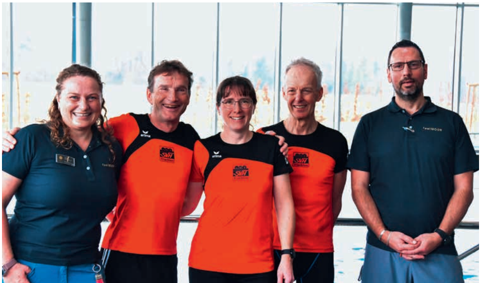
Triathlon-Organisatoren des Spendschwimmens mit den Badmeistern