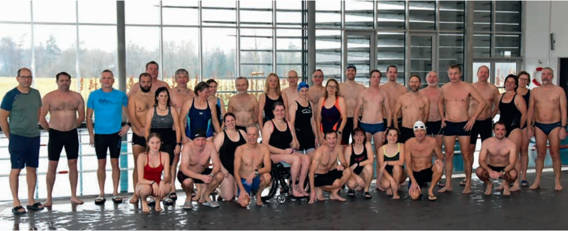
Die immer noch gut gelaunte Schwimmgruppe nach 190 km Schwimmstrecke