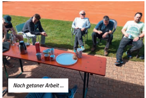
Nach getaner Arbeit ...