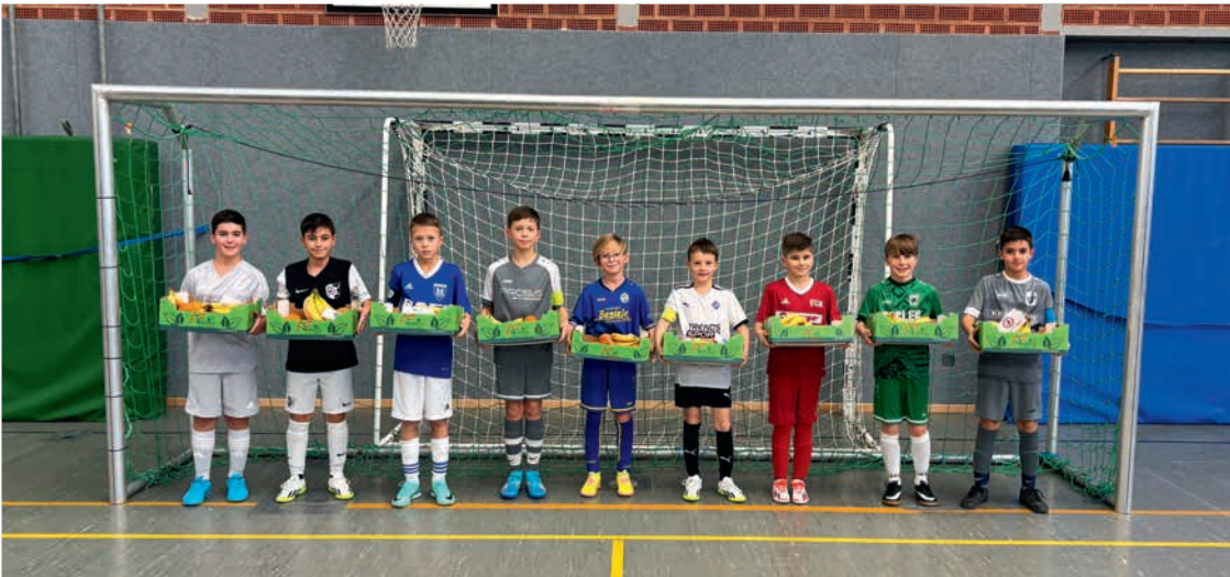
Ein herzliches Dankeschön an Früchte Jork für die Obst-/ Gemüsekörbe.