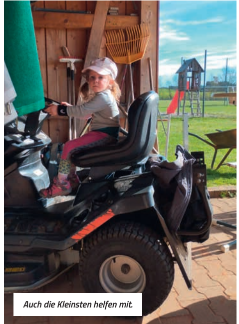
Auch die Kleinsten helfen mit.

Wenn nun noch der Wettergott mitspielt und Sonne und Regen in der passenden Dosierung schickt, steht dem Saisonbeginn Anfang Mai nichts mehr im Wege. Den Auftakt macht das „Bändelesturnier“ am 4. Mai. Hierzu sind alle Tennismitglieder eingeladen mitzumachen.